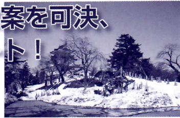
▲整備予定の横手公園

3月定例会は最終日の3月21日に25年度一般会計当初予算案の採決が行われ出席者全員賛成で可決されました。予算規模は501億600万円。前年度と比較し1.9%の増となっています。主な新規事業は次のとおりです。