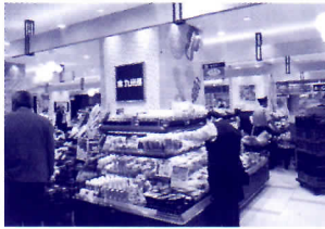
▲ 九州屋・松坂屋上野店

「全国シティプロモーションサミット」では多岐にわたる講演、パネルディスカッションで「シティプロモーションは“まちづくり”そのものである」という認識を深め、有意義な研修となりました。