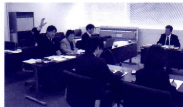
▲ 陸前高田市議会受け入れで説明