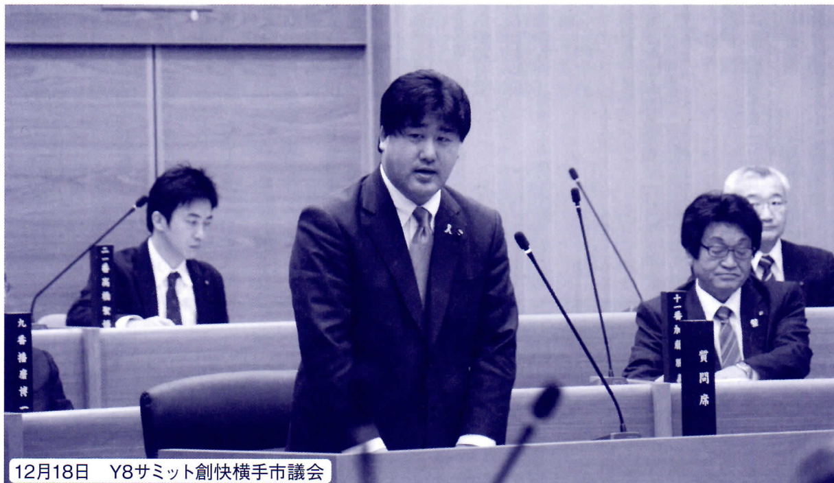
12月18日 Y8サミット創快横手市議会