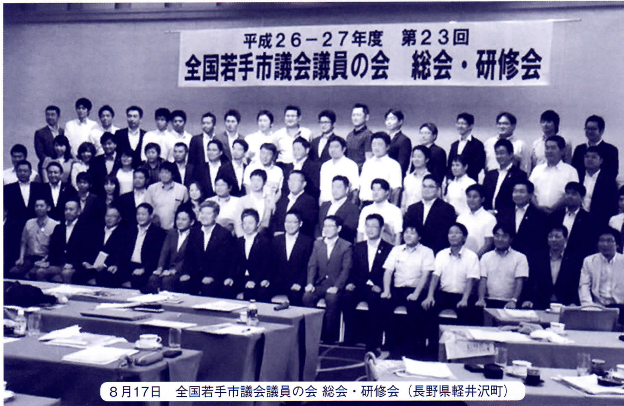
8月17日 全国若手市議会議員の会 総会・研修会（長野県軽井沢町）