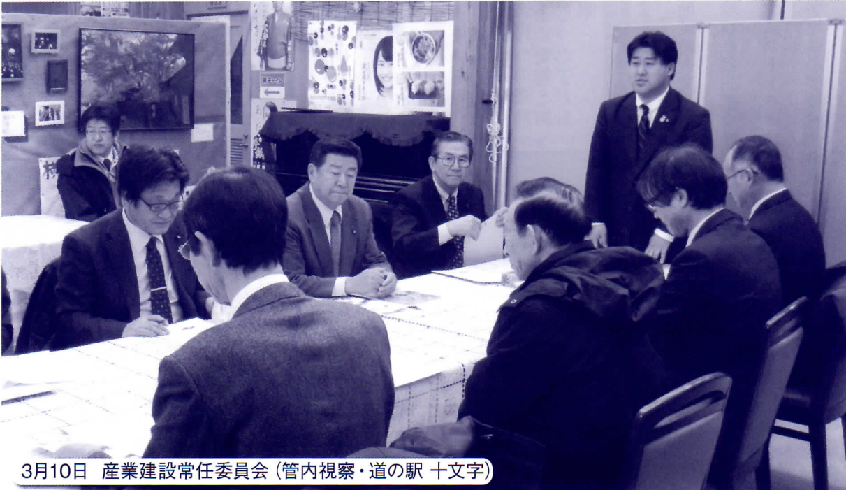
3月10日 産業建設常任委員会 (管内視察・道の駅 十文字)