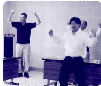
▲チャレンジデーに参加