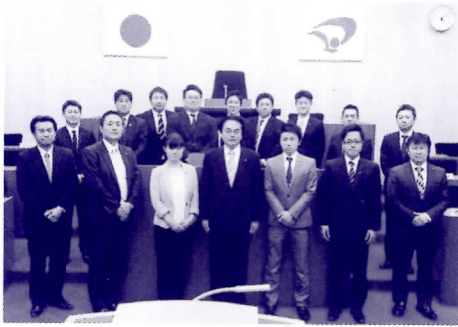
▲大仙市議会議場にて

会員が多数重なっている全若東北ブロックと北東北若手議員の会の合同研修会を大仙市で開催しました。