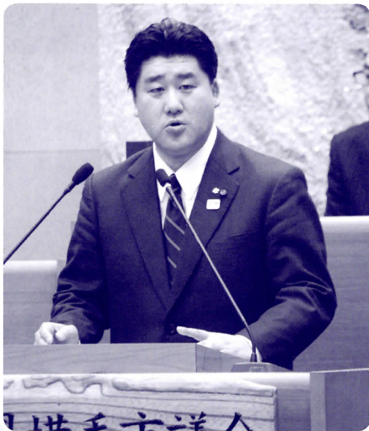
3月22日 常任委員長報告