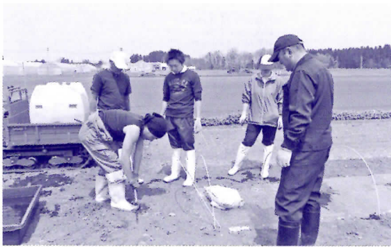
▲実験農場研修生のフォローアップを！