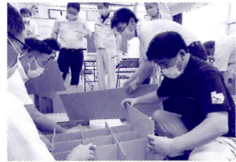
▲総務委 所管事務調査

☆高校の大先輩である菅義偉氏が第99代内閣総理大臣に就任しました。秋田県出身者として初の快挙です。地方に、そして人に優しい政治を願います。