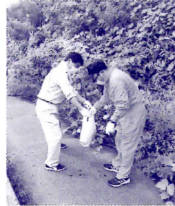
▲連合秋田全県一斉クリーンアップ