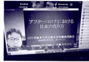
▲NTT 労組東日本自治体議員団総会