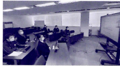
▲広報オンラインセミナー