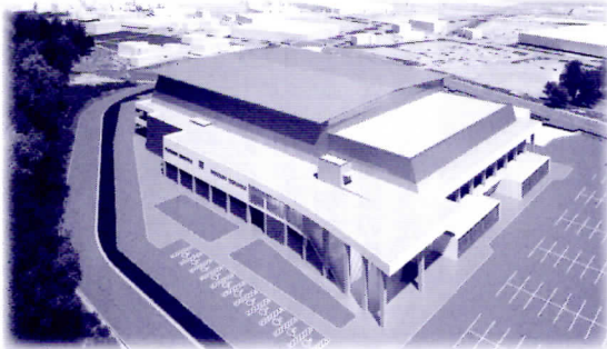
▲横手体育館（南西からの鳥瞰イメージ）